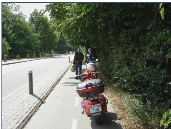
"Strække ben stop" ved "Trolleborg"