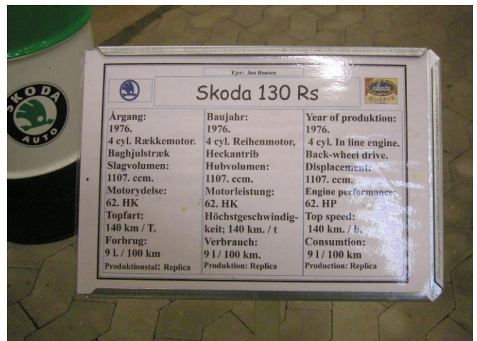
Specifikationer for Rally modellen