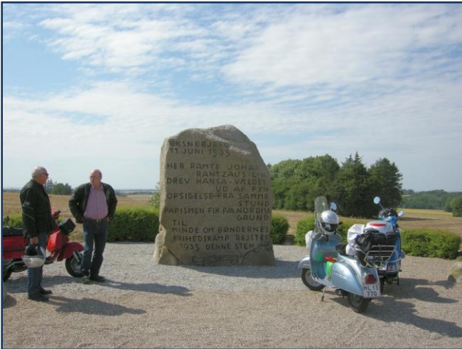
Øksnebjergstenen står højt med god udsigt over Fyn

til Museet, endda så meget at "Moster" flere gange måtte assistere, men frem til Museet kom vi da. Med de mange Skoda historier, der i tidens løb har været "i omløb", så er museet måske ikke det museum, der nyder allerstørst interesse, men det er bestemt et besøg værd, og er i øvrigt det eneste Skoda Museum udenfor Tjekkiet.