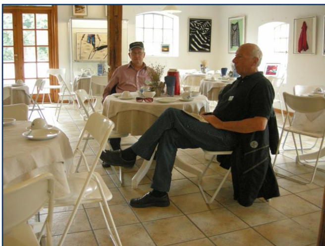
God kaffe på Caféen på Krengerup

Skoda Museet er som nævnt meget seværdigt, men det må dog bemærkes, at en del af de udstillede Skoda modeller og udstillingsgenstande er "i arbejdstøjet", indtrykket kan være, at de bare er kørt direkte ind i museet, uden den store klargøring til museet, en pudseklud kunne hist og her gøre god nytte.