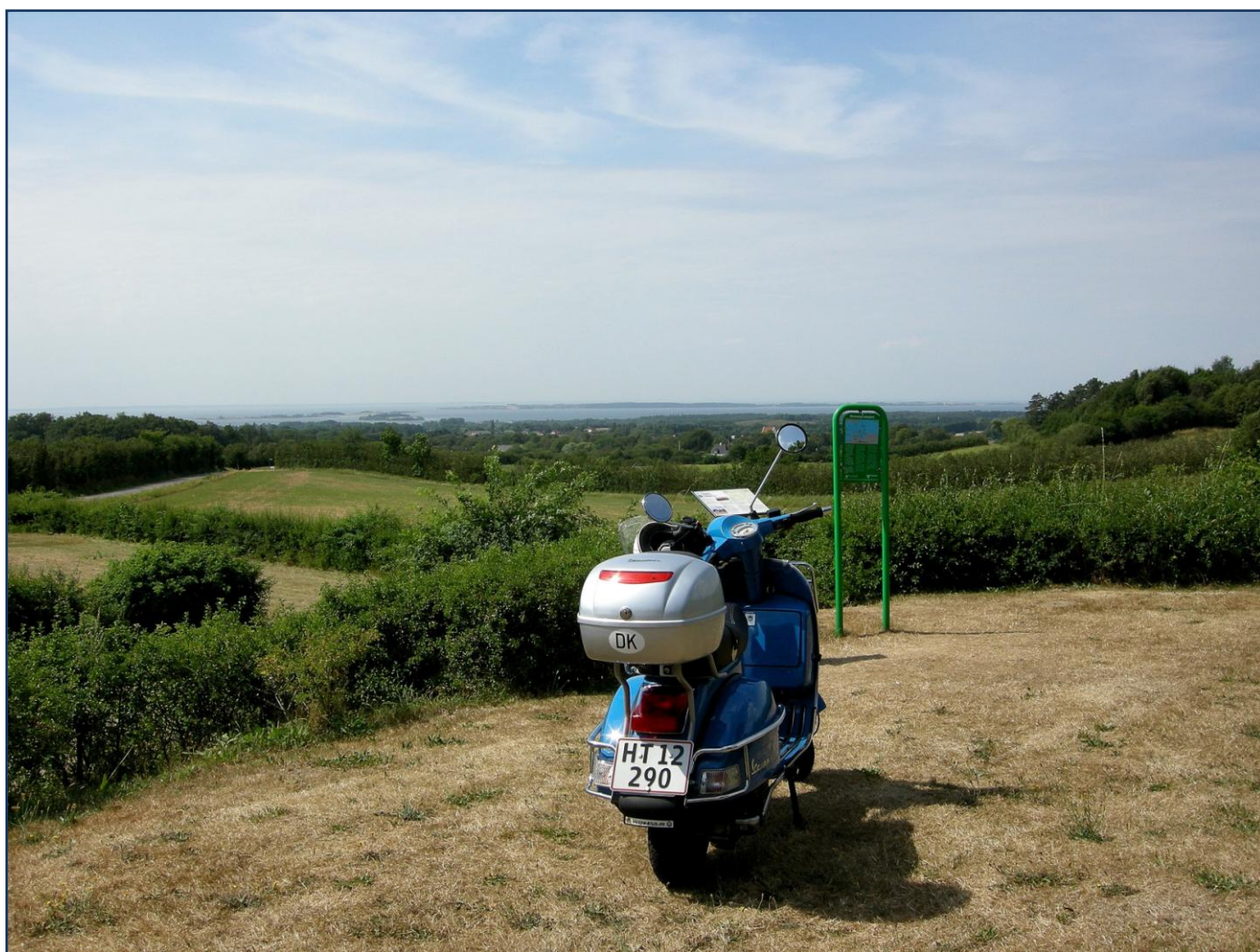
Det flotte udsyn over det sydvestlige Fyn og Helnæsbugten set fra "Dronningesigten"

Men efter at have hygget os lidt med rundstykker og kaffe ved "Statoil havebordene", skulle vi videre til det sydvestlige Fyn. Vi tog først den nogenlunde lige vej nr. 8 mod Fåborg, og selv om det er en landevej, er der meget at se på, bl.a. passerede vi flere herregårde, som bl.a. Egeskov og Brahetrolleborg, det gjorde vi i det hele taget dagen