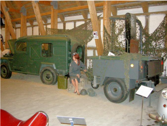
Skoda har også leveret køretøjer til militæret

kan bare Skodaens historie i alle detaljer. Hvis ikke undertegnede havde insisteret på, at jeg var nødt til at trække mig tilbage, grundet den lange vej tilbage til København, havde jeg sikkert stået på Skoda Museet endnu og lyttet til de mange "Skoda guldorn".