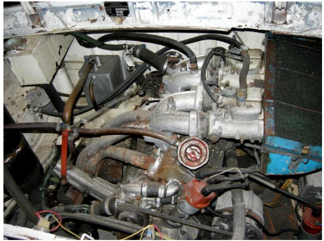
En Skoda motor i "arbejdstøjet"