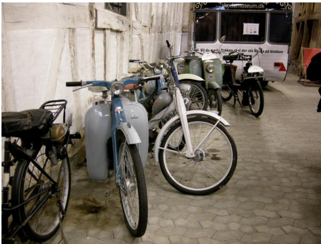
I den kuriøse afdeling var en samling NSU Quickly knallerter og en opstilling med en Express knallert og en BP tank stander