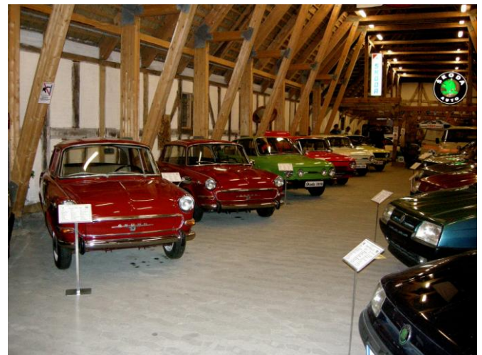
Men Den Gamle Tærsk og Køre Lade på Krengerup er et flot "domicil" for Skodamuseet