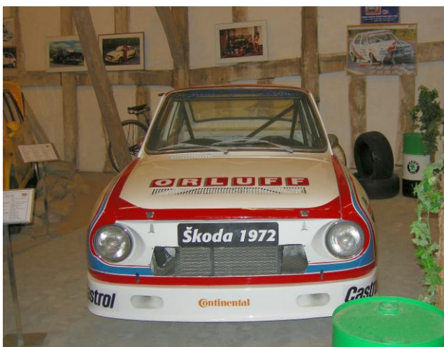
Flot Rally Skoda fra 1972