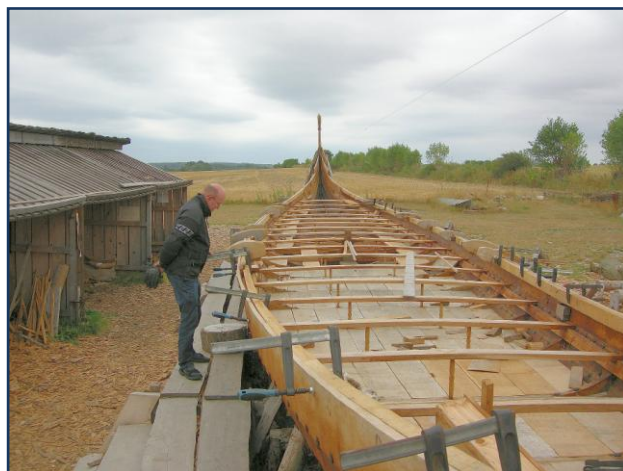
Der blev studeret Ladby skib replica fra flere vinkler

Men snart var vi på havnen i Kerteminde, og kunne nyde en iskage inden turen over Broen. Der var for øvrigt også byfest på havnen i Kerteminde, men den havde vi nu ikke tid til at deltage i. Vi smuttede hurtigt videre ad landevejen mod Nyborg, hvor det var aftalt, at vi lige for en sikkerheds skyld skulle tanke op, inden vi skulle over Storebælt, med den stridende modvind, kunne vi godt forvente at Vespaerne ville behøve mere brændstof end normalt, for at komme til Sjælland. Vi nåede Statoil tanken i god form efter de mange kilometer på Fyn, og fik tanket og aftalt hvilken rute vi ville følge på sidste etape til hjemadresserne.