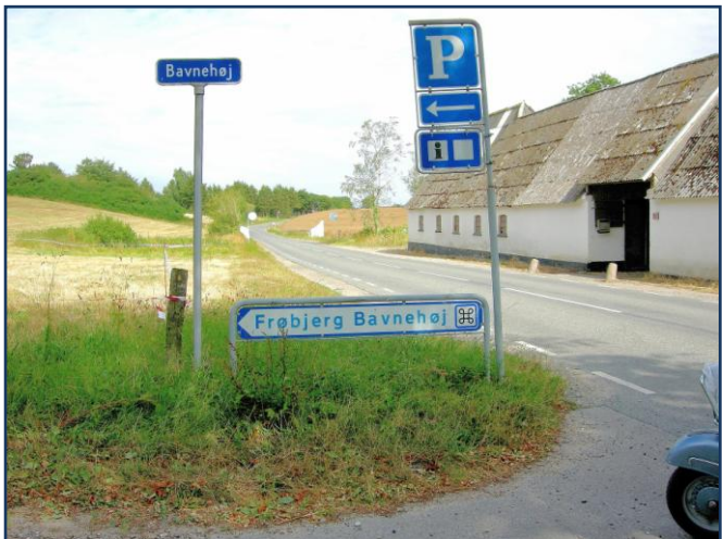
Frøbjerg Baunehøj skiltet var så tæt vi nåede til "Højen"

Der er også indrettet en rigtig hyggelig Café på Krengerup, og kaffe var lige hvad vi trængte til, inden næst sidste "etape", og så var der også tid til at snakke lidt Vespa og Skoda.