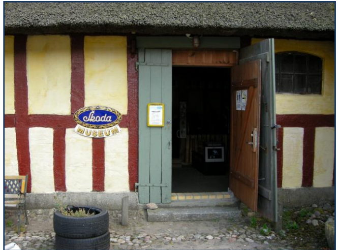
Skoda museets indgang er meget beskedn