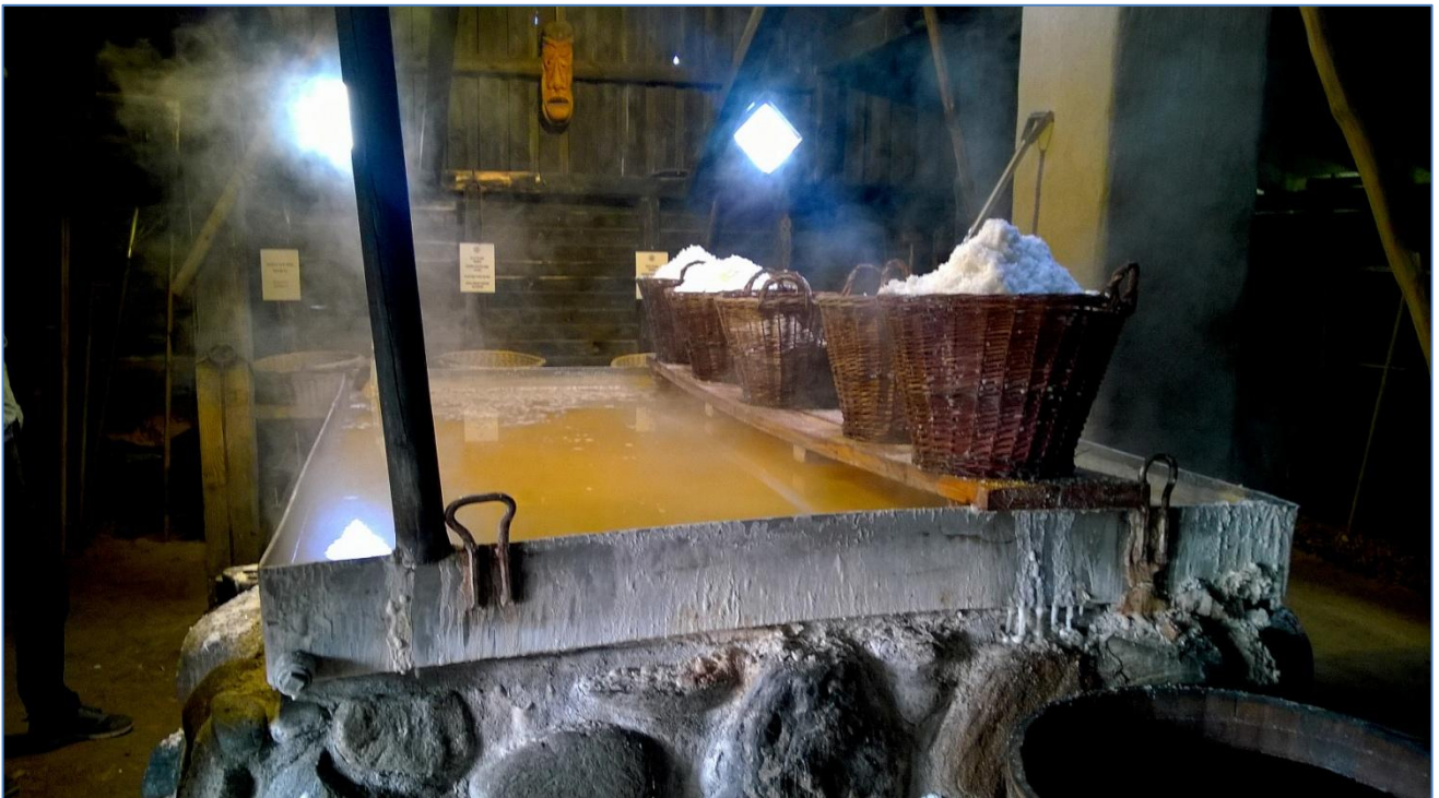
Spændende at se hvordan saltsyderi foregår i "praktiken"