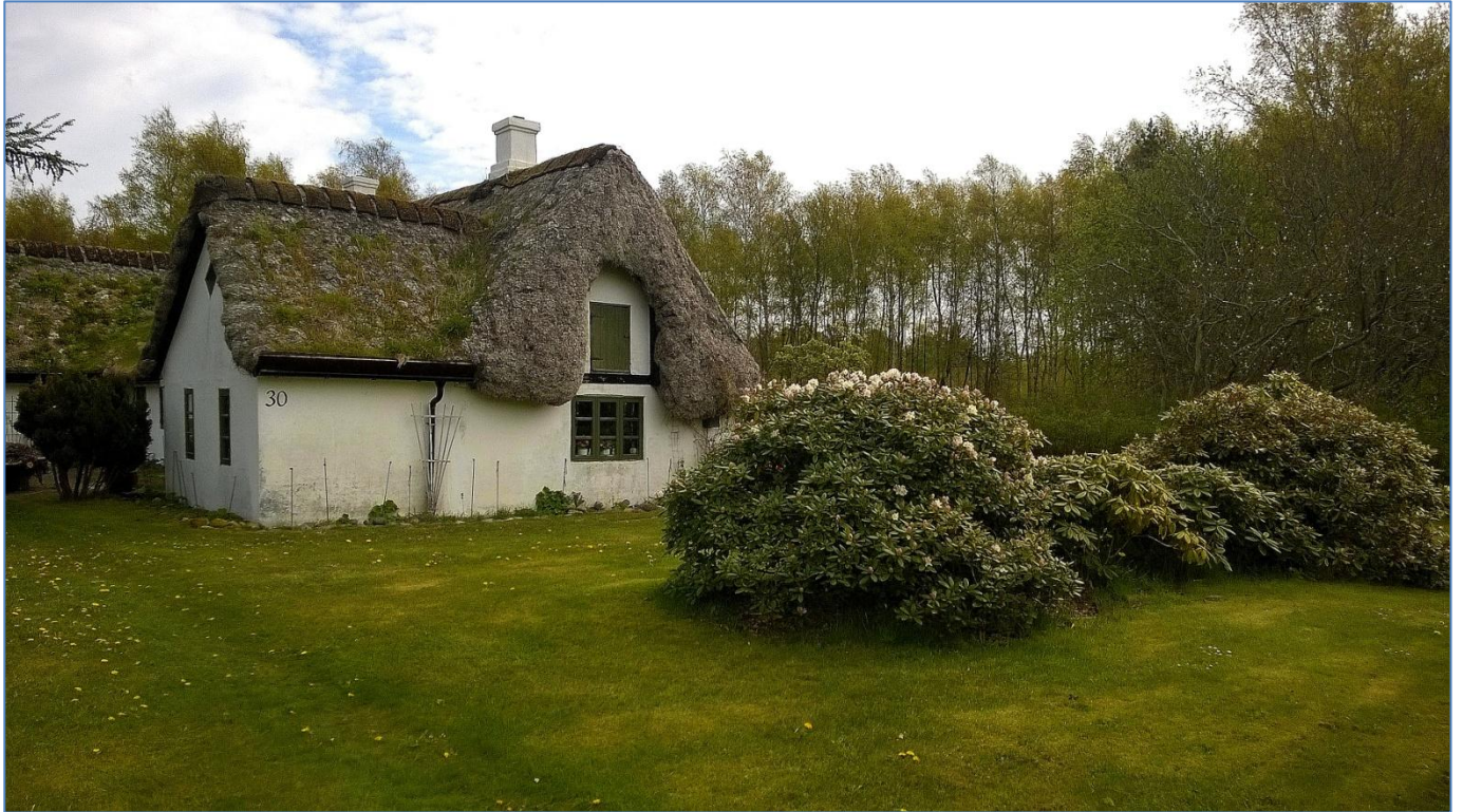
En anden tanggård.

Efter Hedwigs tanggård gik turen ud til Horneks Odde