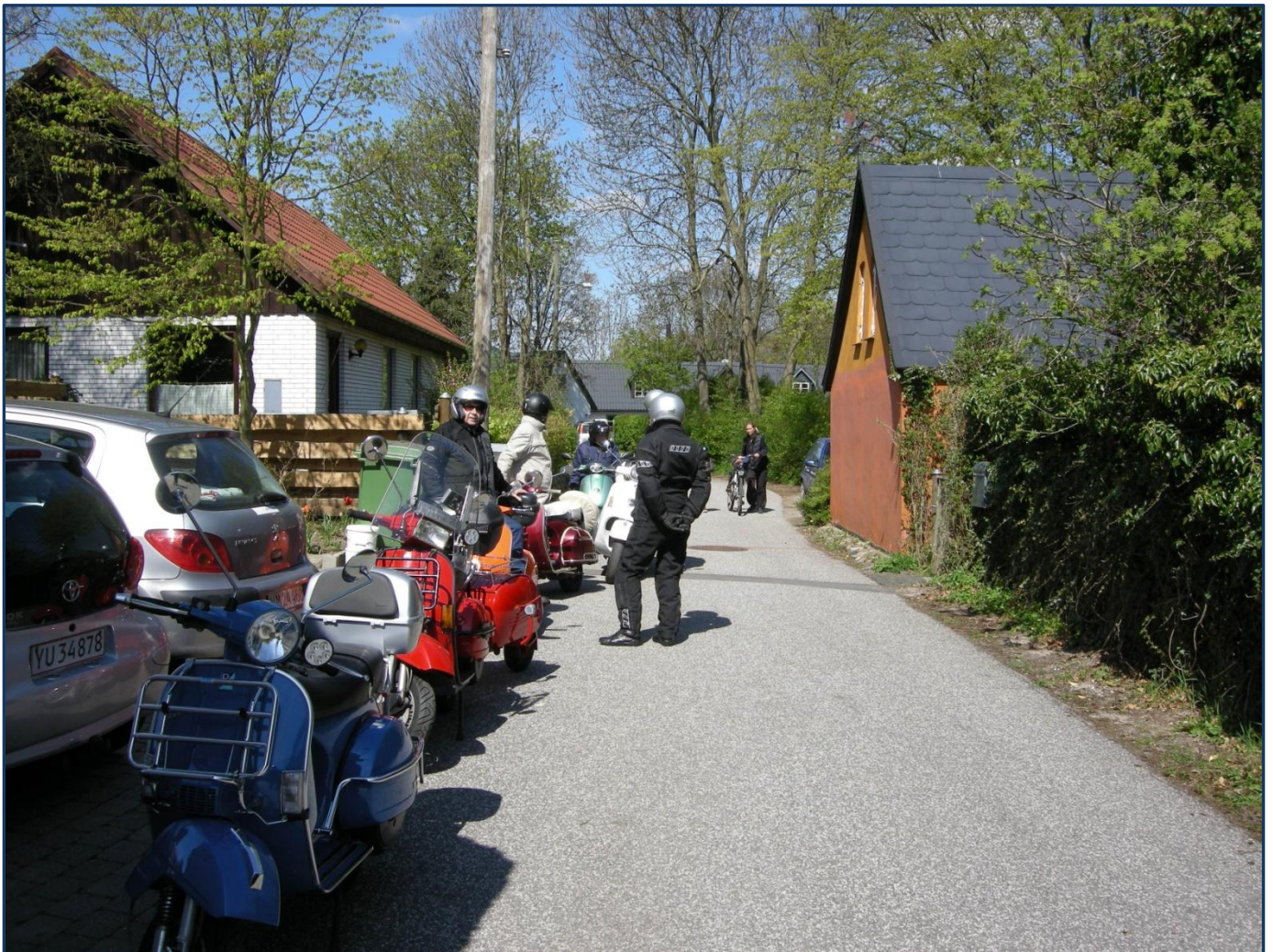
Rundskuehuset er huset med den rødgule gavl til højre i billedet

Den gamle Roskilde Landevej ved Damhussøen. (1905). Bomhuset, hvor der skulle betales bompeng for at benytte landevejen, ses til højre. "Betalingsring/bompeng" er ingen ny ide. Der er dog sket lidt med trafiktheden siden 1905.