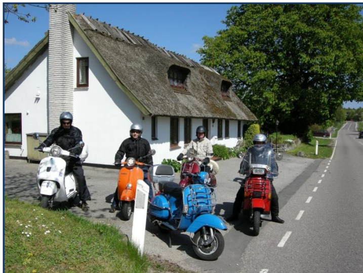
Stop ved huset "Rolighed" i nærheden af Vridsløsemagle

Roskilde kro på Snubbekorsvej i sine velmagts dage (ca.1772) med stald på den ene side af Snubbekorsvej og beværtning på den anden, hvor der i en driftig forretning var rum for både de kongelige og hver mand.