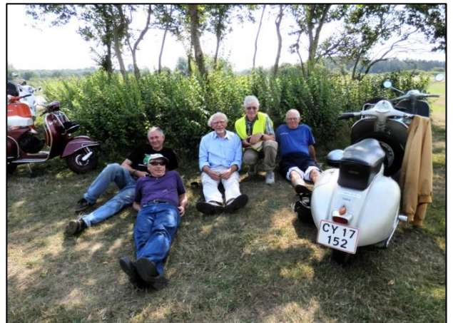
En forbigående tog et gruppefoto