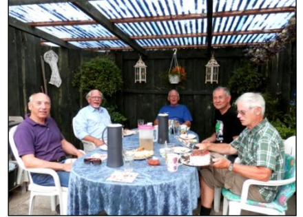
Der er sagt vær's go' og begynd.