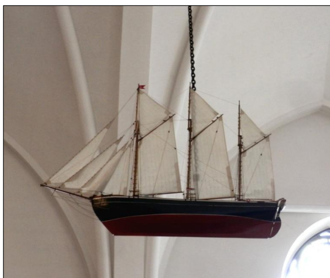
Kirkeskibet er en model af skonnerten Fulton

Uden for turen kan oplyses, at i Frederiksværk midtby ligger Gjetshuset, der fungerer som attraktivt Kulturhus, og som er en del af det oprindelige støberi bygget i 1761, hvor kanonerne blev fremstillet.