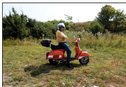
Jørn på sin sprit nye Vespa GTS 300 ie Super.