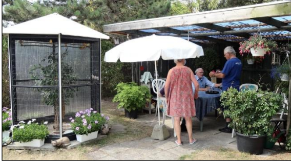
Den overdækkede hygge-krog ved Volieret

Det var tredje gang vi kommer på besøg og forventningerne var derfor høje til Hannes Lagkage, som der også denne gang var stor afsætning på, og som indfriele vore vildeste forventninger.