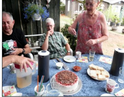
Så er Lagkagen serveret