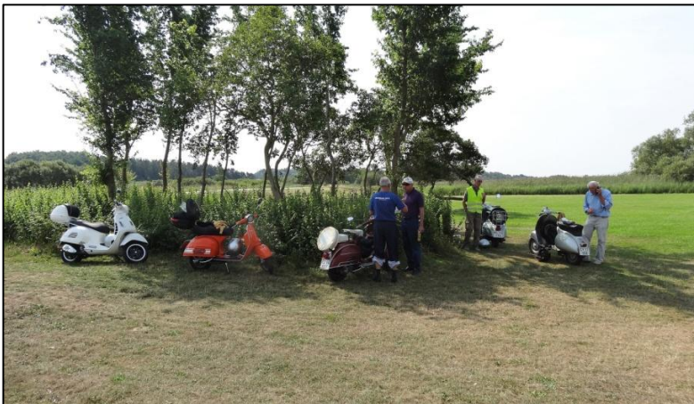
Rasteplassen ved Pøleå der ligger ved den østligste ende af Arresø

Af sted kom vi da, og nåede ret hurtigt frem til den store rasteplass ved Pøleå. Her var der sket noget nyt siden sidste år, idet et antal store gamle, skyggefulde træer var fældet. Vi satte os på skyggesiden af en forholdsvis ung gruppe træer for at spise vore medbragte madpakker og drikke noget vand eller kaffe.