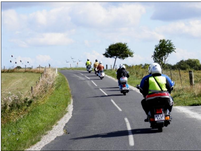
Moderat tempo i små bløde sving og på svage stigninger