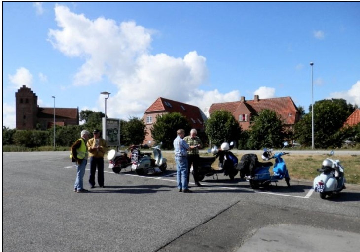
Nogen møder før andre, og så går hyggesnakken