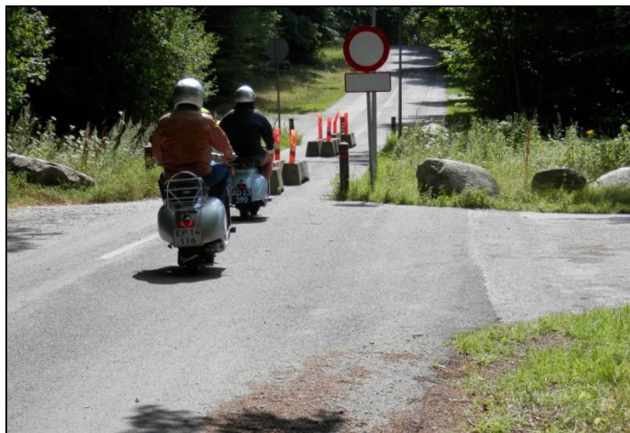
Ved Arresødallejren er der lavet en sluse for 2-hjuls køretøjer

Vi passerede gennem Vinderød, hvis kirke og kirkegård har noget specielt. Inde i kirken er der en stor skulpturgruppe i en hvælving med en scene fra bibelhistorien og på kirkegården, der naturligvis er en traditionel gravplads, har en gruppe kunstnere lavet et stort antal eksempler på, hvordan gravsten og andre former for stenskulpturer i en kunstners hænder, kan anvendes i forbindelse med gravsteder. Referenten har tidligere på året besøgt stedet og blev ganske forbløffet og imponeret over, hvilken fantasi der kan lægges for dagen. Et besøg ved lejlighed, kan varmt anbefales. Kort efter var vi fremme ved den gravede kanal, hvor det gode skib M/S Frederikke stævner ud fra og sejler Arresø tynd i sommerperioden. "Hun" er bygget på Holbæk skibsværft i 1965 og sat ind som turbåd på Arresø i 1992. Rolf ville efterfølgende, gerne vise os mere af kanalen, og førte os ned i selve Frederiksværk bymidte, hvor kanalen ligger bag gågaden og parallelt med denne.