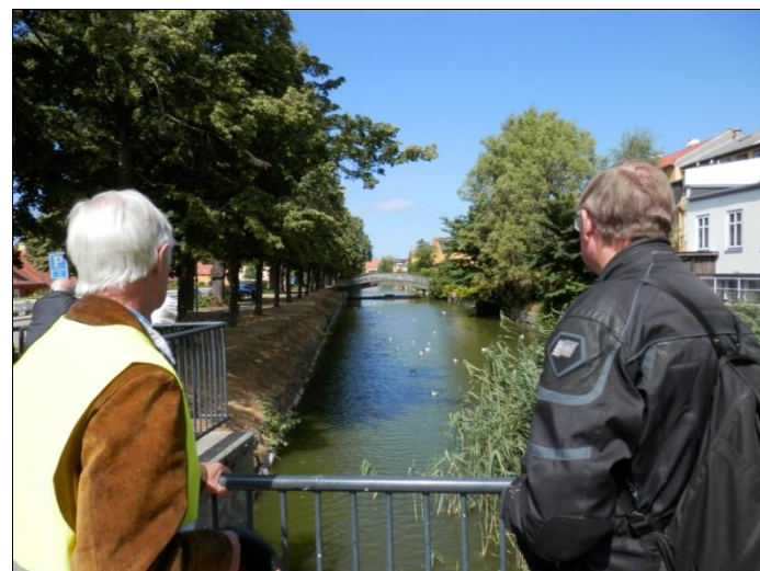
På grund af sommervarmen fylder algerne godt i kanalen