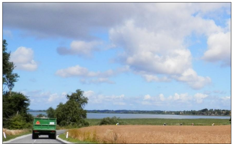
En bred og langsom korntransport deler gruppen

Høstsæsonen var i fuld gang, så der duftede dejligt og vi passerede både kornmarker der ventede på at blive høstet og stubmarker, samt forskellige landbrugsmaskiner i aktion på markerne og på landevejen. Det betød at der forekom transport af det tærskede korn hjem til gården og det fylder godt på de små smalle biveje med mange sving, og som det fremgår af billedet til højre, kan det være svært at komme forbi sådan en bred transport i samlet flok, selv om traktorens hastighed kun er omkring 40 km/t.