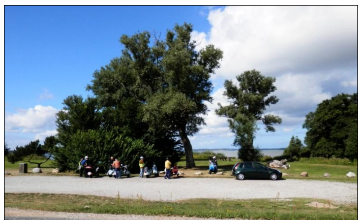
Ude bag træerne og græsplænen ligger Arresø