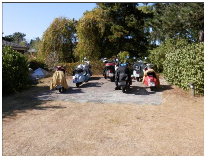
Det brune område i forgrunden er en hvilende græsplæne