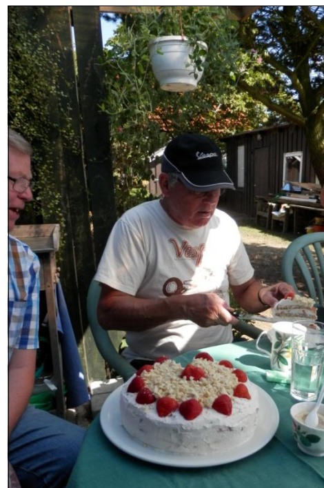
Ove ser om der bliver noget til ham