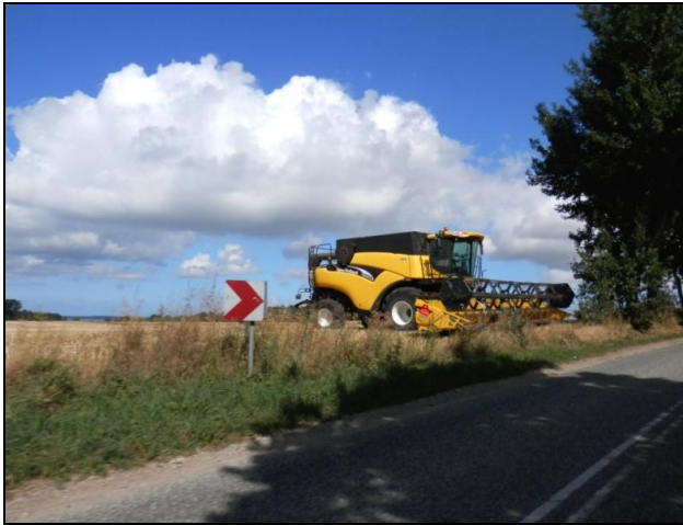
Mejetærsker i hvilestilling