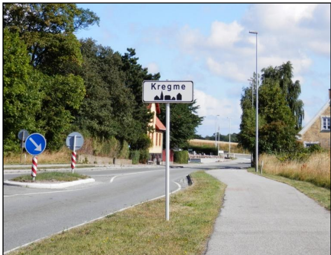
Indkørslen til Kregme fra frederikssundsiden

Mødestedet var Statoil tanken i Kregme, kl.10.00