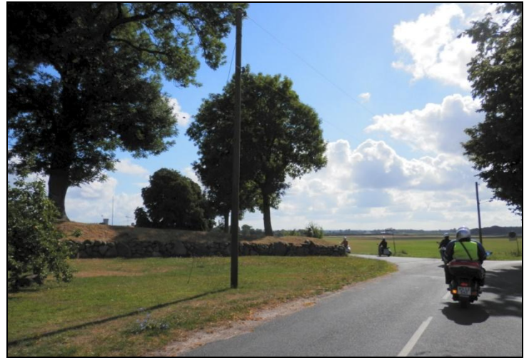
Vi suser forbi 3 gravhøje ☹ uden at give os tid til at stoppe.