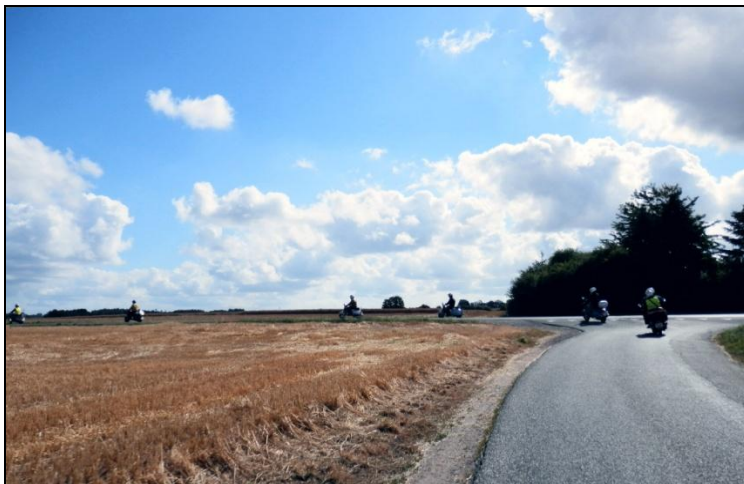
Marken er mejet og kornet er høstet, ... ..