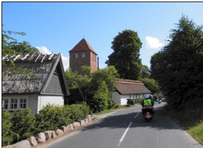
Idylliske småbyer med vejen helt op ad husene