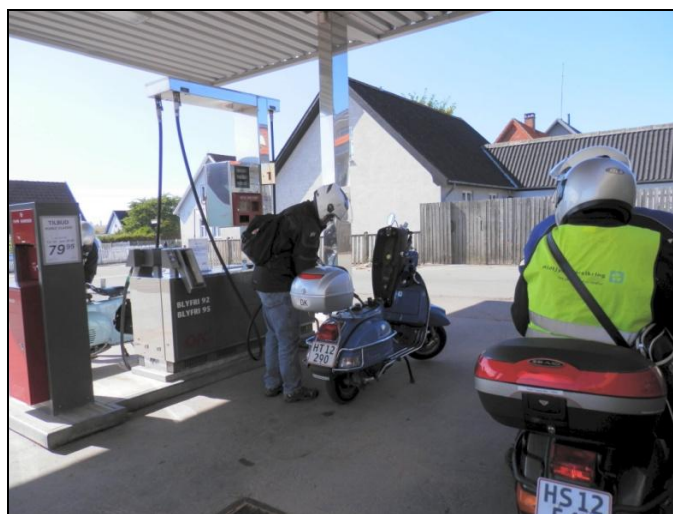
Vespa'eren skal også have noget at "leve af"