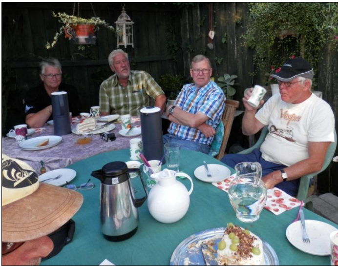
Dejligt kaffebord, og iihhh ! hvor vi spiste os mætte.