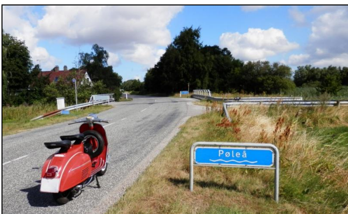
Pøleå, - jamen!, det hedder den altså, - åen.