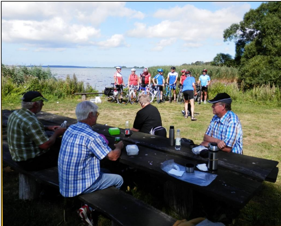
Nogen kommer frem med motorkraft og andre foretrækker "rugbrødsmotoren"

At pladsen er et populært sted at holde pause, viste sig medens vi var der, idet flere enkeltpersoner, par eller grupper, holdt hvil på pladsen, Nogen benyttede de opstillede borde og bænke, - nogle i sol og andre i skyggen fra de store, gamle træer.