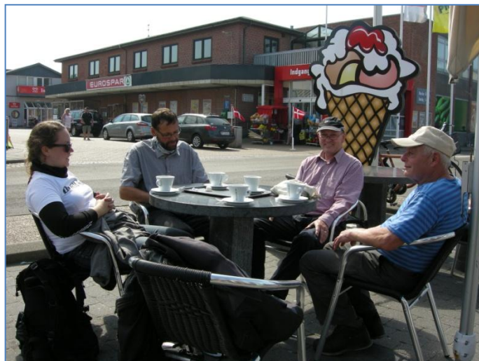
Ingen kage i Hvide Sande, men kaffen den var god