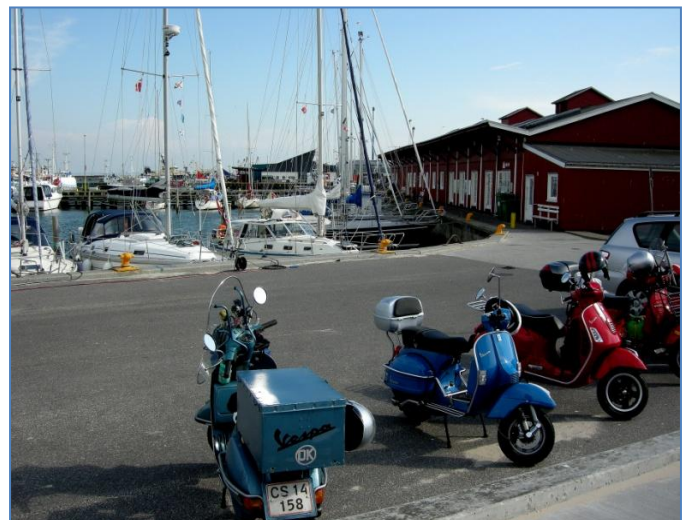
På Havnen i Thyborøn