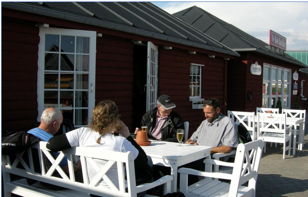
En lille fad hos "De Røde Barakker", til at fjerne det værste landevejs støv før maden, var ikke dårlig