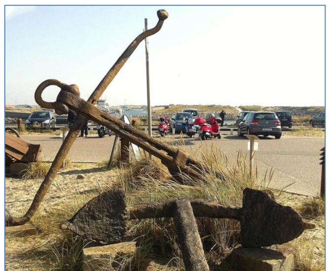
Et af Museets mange gamle ankre