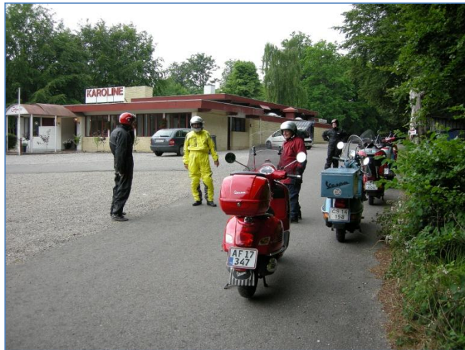
Regntøj på ved Karoline restauranten i Middelfart