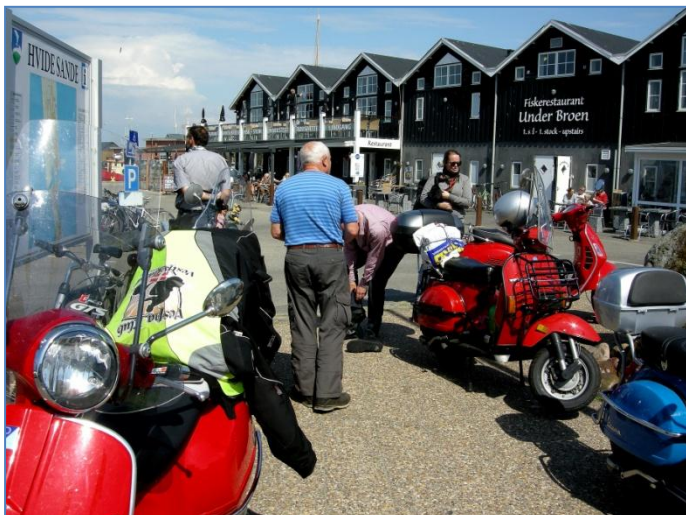
I Hvide Sande var der kaffepause, og med 25° i skyggen, så var det også dejligt, at komme af med det varme tøj

Fra Jelling gik det vestover, forbi Vandel og Billund, Grindsted, Ølgod og Nr. Nebel til Nymindegab. Godt nok en relativt flad strækning, men meget varieret, når man kører på de mindre biveje, som vi gjorde. I dette kartoffel "Land" havde kartoffel markerne oven i købet bredt deres flotte tæppe af hvide eller lilla blomster ud. Efter en tankning i Nymindegab fortsatte vi op mod Hvide Sande. Turen på landtangen mellem Vesterhavet og Ringkøbing fjord er jo meget præget af de store klitter og de gamle klitgårde, et lidt barskt landskab, men stadig med sin egen skønhed i behold. Sine steder er området dog også plastret til med sommerhuse i alskens forskellige "stilarter", man kan nok sige, at der er gået lidt "Dyrehavsbakke" i den ellers så smukke natur, turismen kan nogle steder have sin pris.