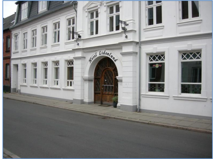
Vi nåede lige en hyggelig stund ved havnen i Lemvig, inden vi gik til ro på vort nat logi, Hotel Lidenlund