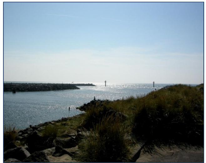
Indsejlingen til Thorsminde i modlys