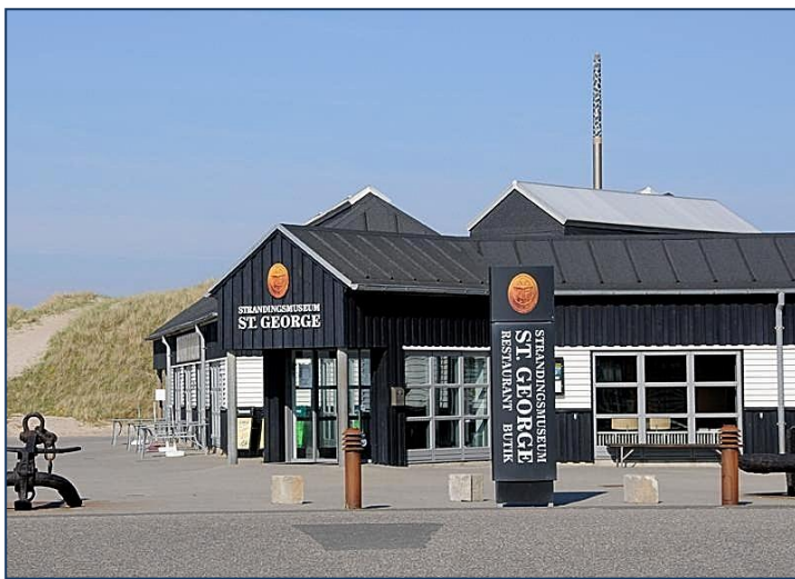
Strandingsmuseet St. George i Thorsminde