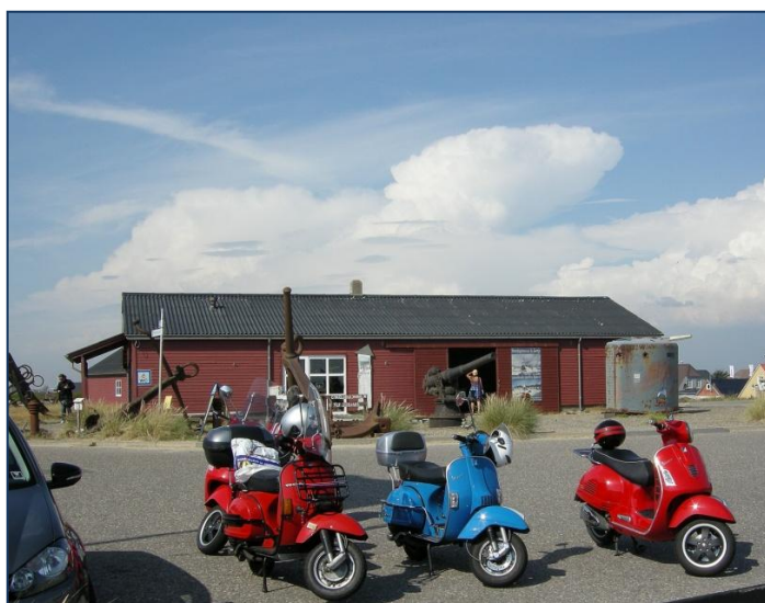
Vore tro Vespaer med en del af Strandingsmuseet som baggrund