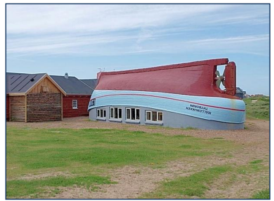
L 299 - "Mallemukken" i Thyborøn