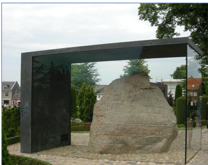
Den store Jellingesten i ny "indpakning"