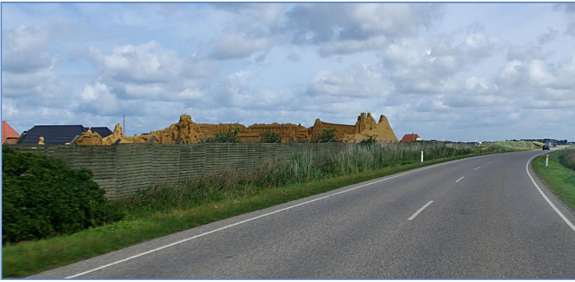
Sandskulptur udstillingen ved Søndervig, set i farten