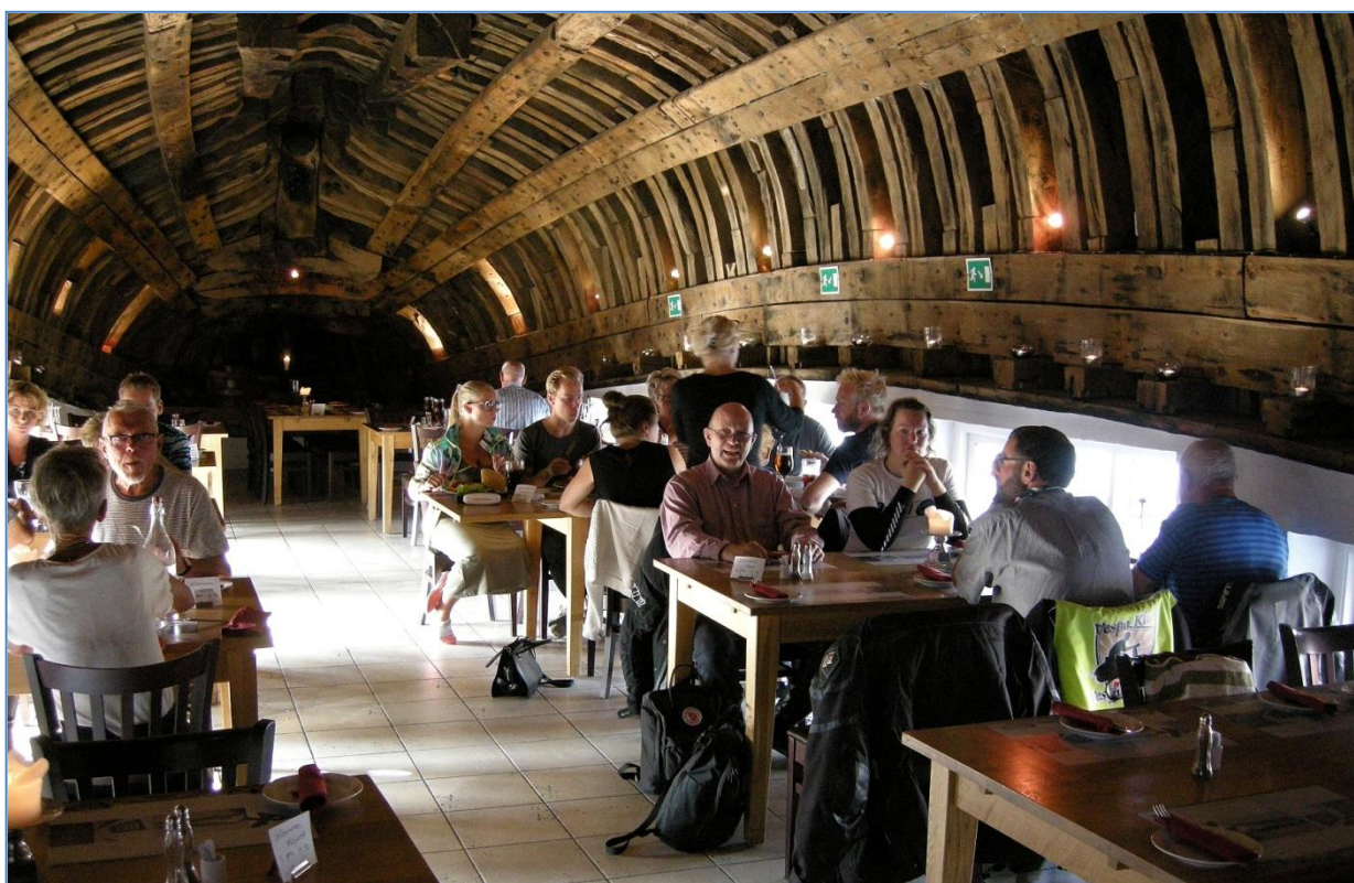
Så er der endelig aftensmad i "Malle mukkens indre"

Men vi skulle jo også se at komme til "Lidenlund" vores hotel og natlogi i Lemvig, så til sidst måtte vi tage afsked med "Malle mukken" og køre dagens sidste kilometre til Lemvig. Nu havde vi dog fået vinden imod, og det skal jeg love for, at vi kunne mærke, Vespaerne måtte virkelig slide i det, næsten fuld gas for at holde en nogenlunde frisk hastighed, omkring de 70 -75. Snart var vi dog i Lemvig, og nøglerne til vore værelser lå på kasseapparatet som aftalt. Vi fandt vore værelser, men havde heldigvis lige tid til at gå en tur i byen. Vi "daskede" ned til havnen og nød en enkelt fad, inden vi skulle tilbage til "Lidenlund" og sove. Der er meget roligt i Lemvig sådan en lørdag aften, så vi blev bestemt ikke forstyrret af støj fra gaden, da vi gik til ro.