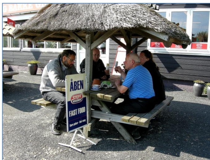
Sidste lille fælles stop på Båring Bakke

I Odense havde vi først planlagt at køre ind omkring Thomas B. Thriges gade, men den er her på det seneste blevet lukket, så vi måtte finde en anden vej. Det blev Ringvej 02, og det lykkedes også nogenlunde, det var undertegnede, der var turguide på denne strækning, men Finn's "Moster" blev alligevel sat på opgaven til sidst og inden længe var vi på det helt rette spor, mod Kerteminde. Vejen mod Munkebo løber langs med Odense fjord, og det giver rigtig gode udsigter, og det lukkede Lindø Værfts store portal kran stikker stadig "hovedet" op over Munkebo. Inden længe var vi dog i Kerteminde, og kunne "snuse" lidt til byens hyggelige atmosfære. Det var egentlig meningen, at der også skulle være et stop i Kerteminde, men turlederen, alias undertegnede, havde fået